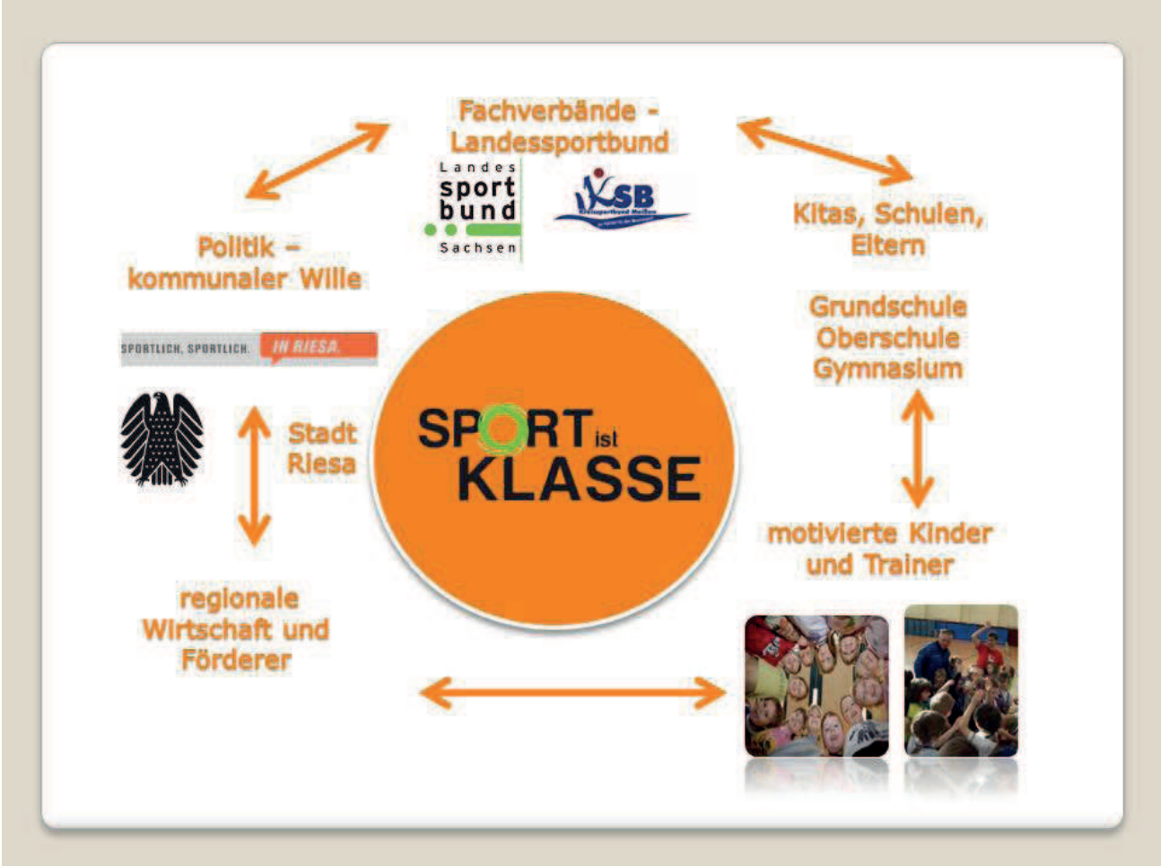
Abb. 8: Vernetzung