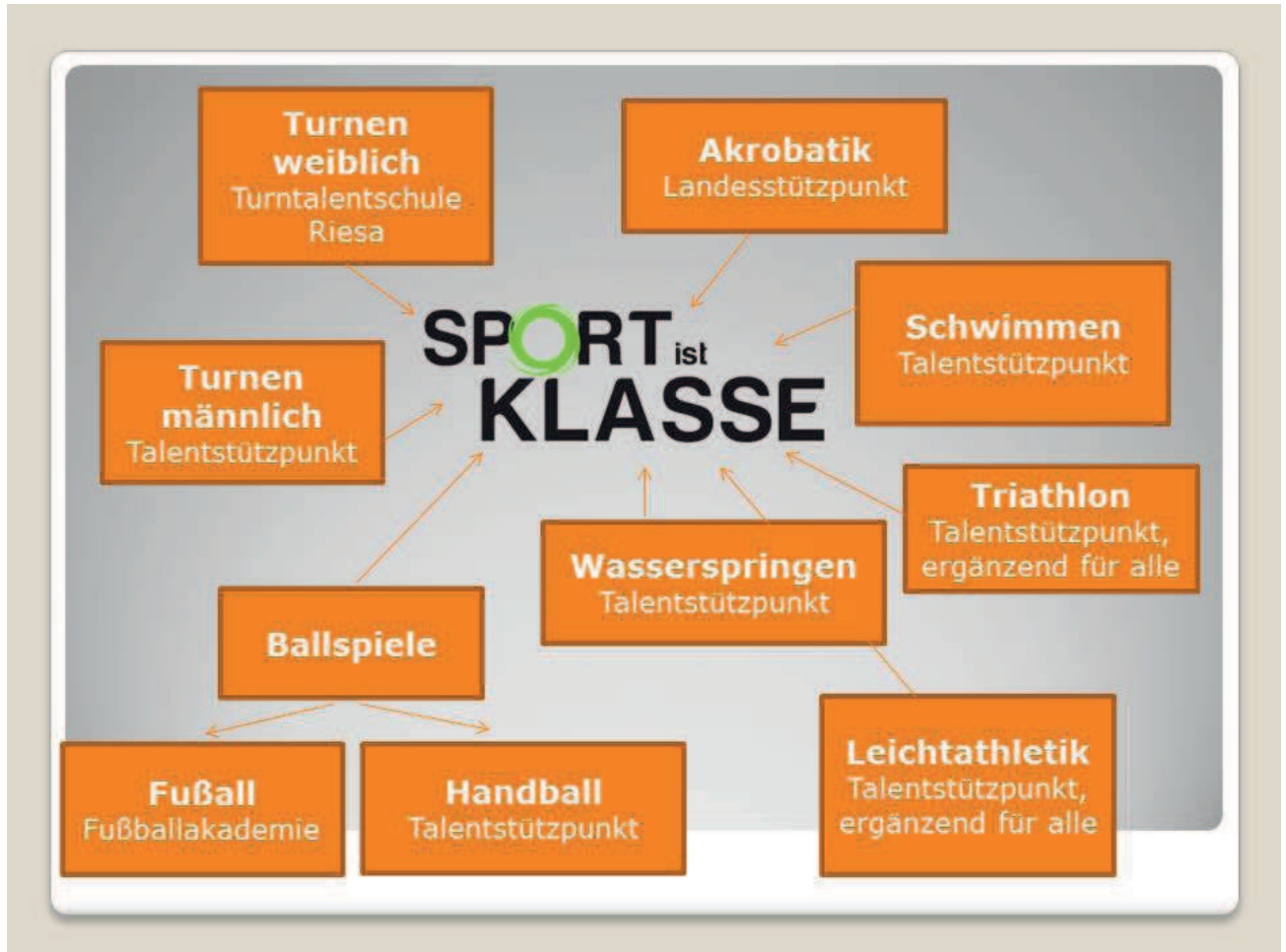
Abb. 4: Übersicht der Talentstützpunkte