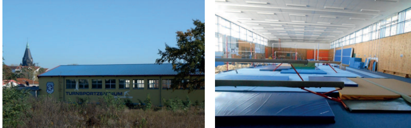
Abb. 6: Turnsportzentrum