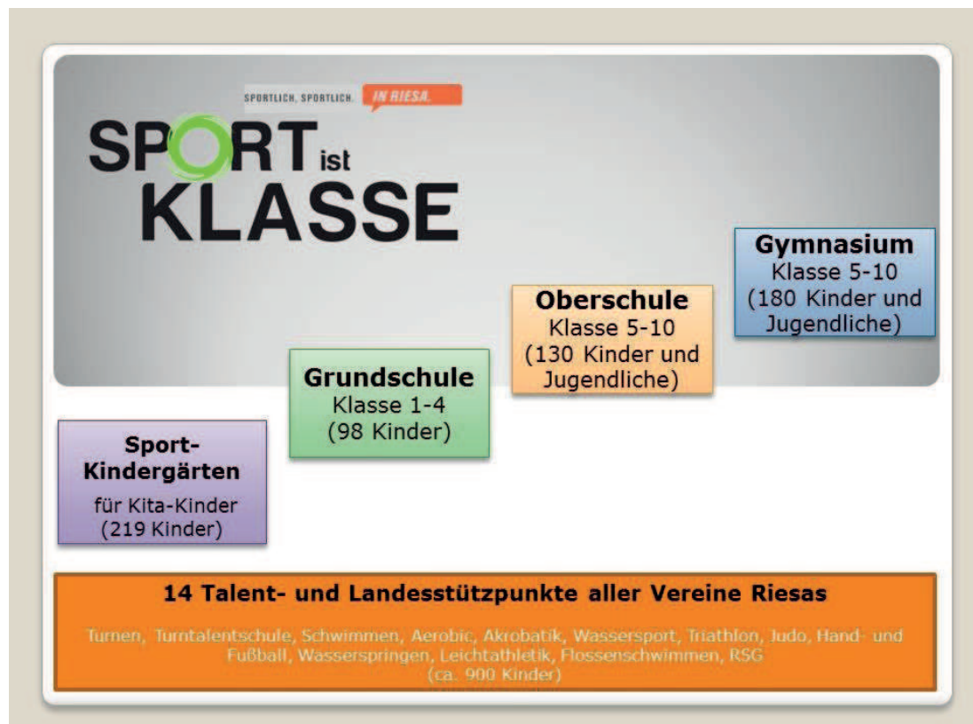
Abb. 1: Stufenmodell

Schülerinnen und Schüler im Projekt „Sport ist Klasse“ absolvieren zu den regulären, im Lehrplan der jeweiligen Klassenstufe festgelegten Sportstunden wöchentlich zwei bis vier zusätzliche Sportstunden im so genannten Blockmodell und durchlaufen dabei in sechswöchigen Blöcken verschiedene Sportarten. Die Auswahl der Sportarten orientiert sich dabei an den im Lehrplan festgelegten Kernsportarten: Turnen, Schwimmen, Leichtathletik, Ballspielarten (Fußball, Handball) und Judo. Ergänzt wird das Angebot durch Triathlon als übergreifende Sportart. Die zusätzlichen Sportstunden realisieren Regionaltrainer und landesgeförderte Trainer in enger Zusammenarbeit mit den jeweiligen Schulen. Begleitet wird das zusätzliche Bewegungsangebot bereits im Vorschulalter durch die in Riesa bestehenden drei Sportkindergärten sowie die bei den Vereinen verankerten Talentestützpunkte. Im Schuljahr 2014/2015 nehmen mehr als 600 Kinder in der Stadt Riesa ein zusätzliches Bewegungsangebot in Anspruch, das Stufenmodell ist in Abbildung 1 dargestellt.