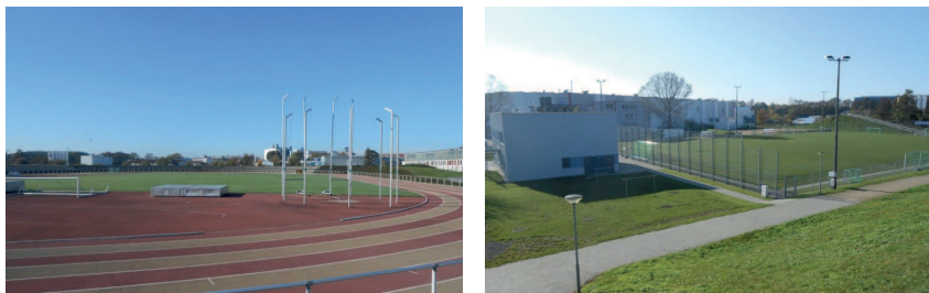
Abb. 7: Leichtathletikstadion und Kunstrasenplatz